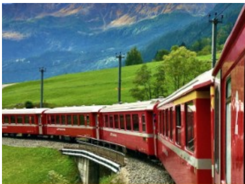
Trenino Rosso del Bernina