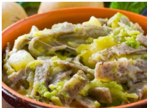
Teglio patria del Pizzochero